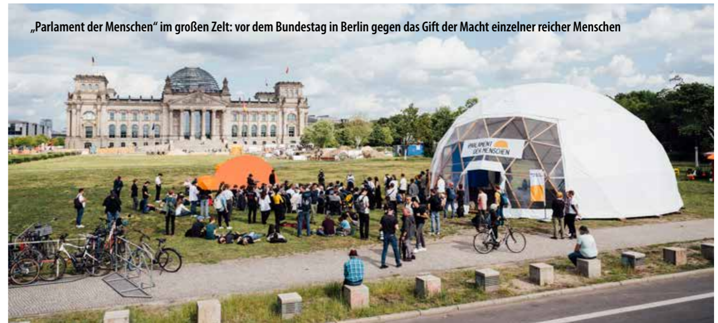
„Parlament der Menschen“ im großen Zelt: vor dem Bundestag in Berlin gegen das Gift der Macht einzelner reicher Menschen

Kriege. Wer kümmert sich denn da noch um ein schönes Gemälde oder das intakte Brandenburger Tor? Niemand! Unsere Aktionen waren ja immer auch im Respekt vor dem geführt, was es zu schützen gilt. Es sollte sich nicht gegen den Normalbürger richten, sondern gegen die, die unsere Welt zerstören, also die so genannten „oberen Zehntausend“.