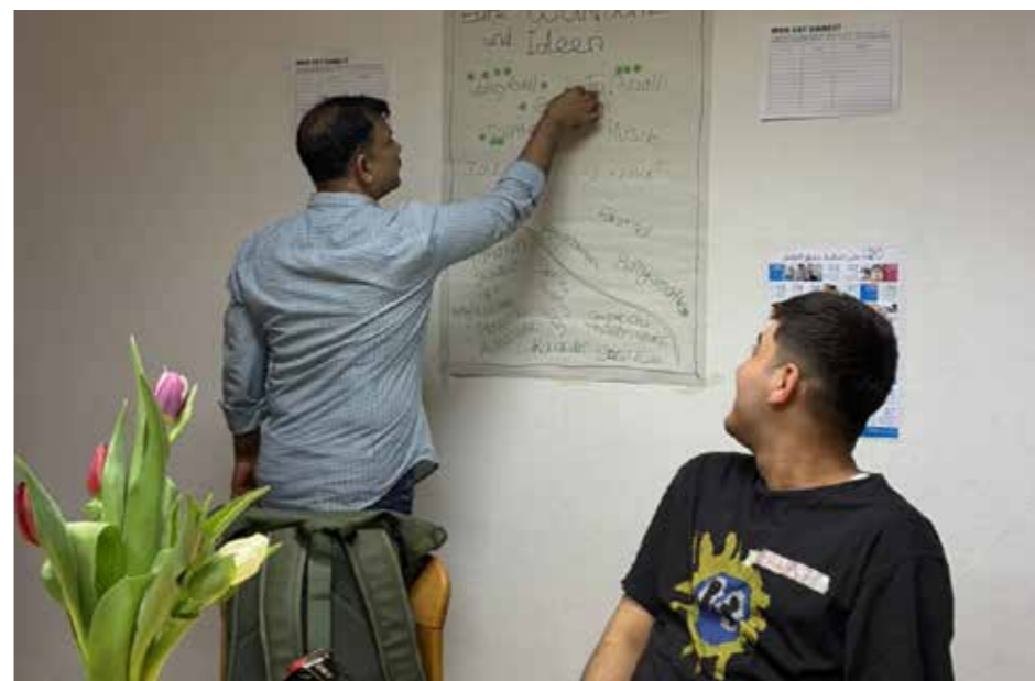
Ideen und Wünsche für Pinnow