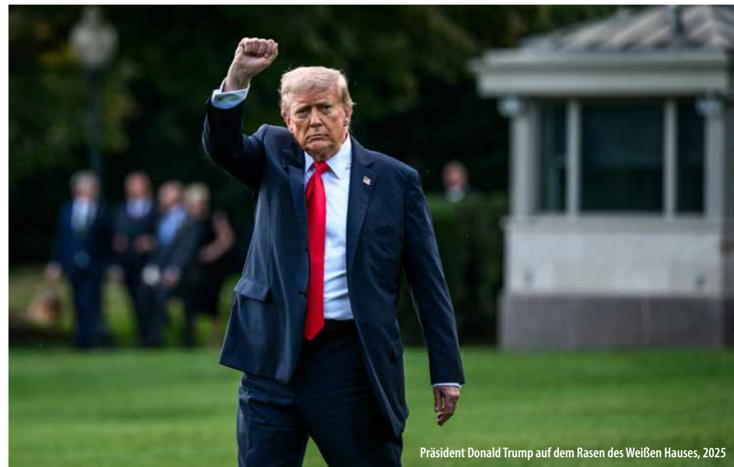
Präsident Donald Trump auf dem Rasen des Weißen Hauses, 2025

Tagtäglich erreichen uns Nachrichten von einer rastlosen Wachstumspolitik, die hochmütig versucht, die Grenzen der Natur zu ignorieren und die das Weltklima bedroht. Dabei ist längst klar, dass es zur Ungleichverteilung der Einkommen führt, weil die Maßnahmen der Politik vorrangig Unternehmen und höheren Einkommensschichten zu Gute kommen.