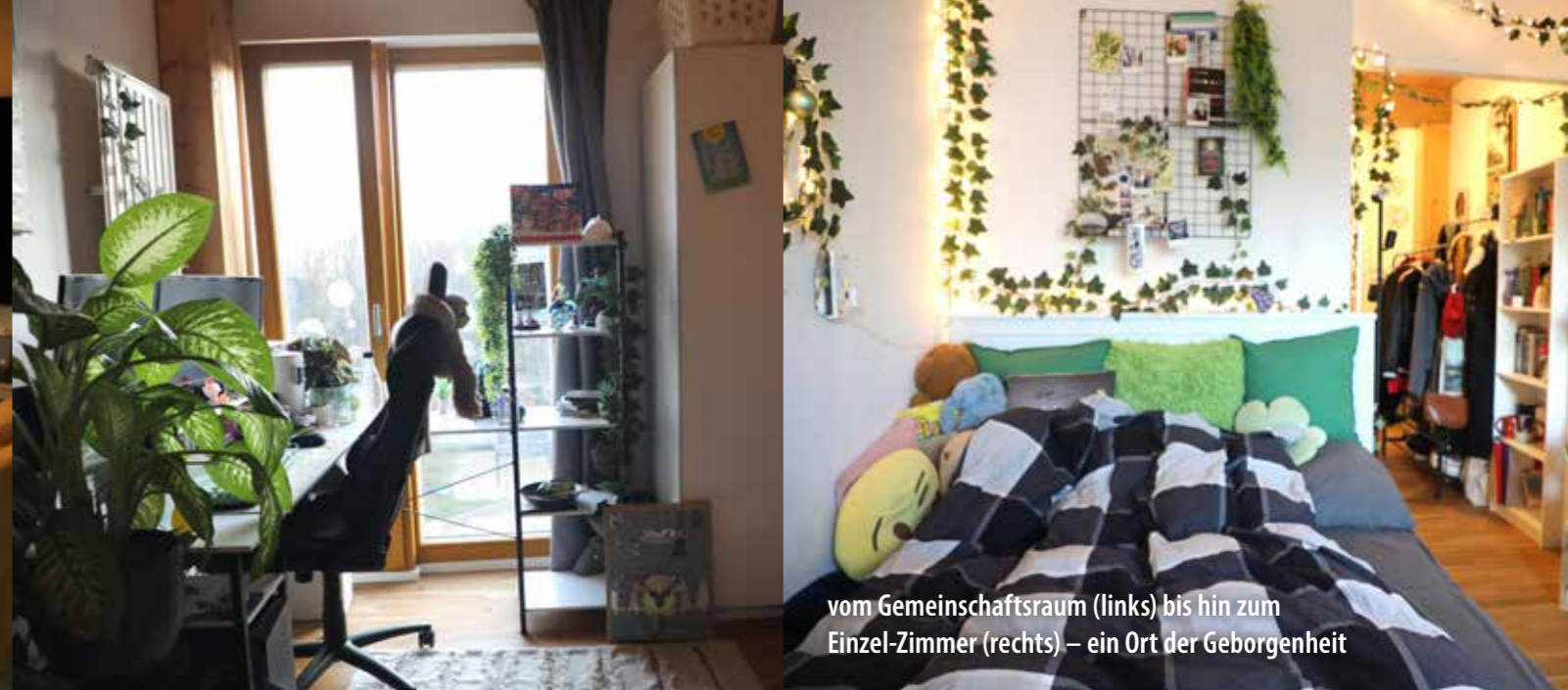
vom Gemeinschaftsraum (links) bis hin zum Einzel-Zimmer (rechts) – ein Ort der Geborgenheit

Seit fünf Jahren bietet SozDia mit dem Queerfeld ein junges Menschen aus dem queeren Spektrum einen sicheren Ankerplatz – und jetzt ist dieser sogar ein Stück größer geworden: das neue Queerbeet hat seine Türen geöffnet und ergänzt das Angebot direkt nebenan im ruhigen Kiez von Berlin-Weißensee.