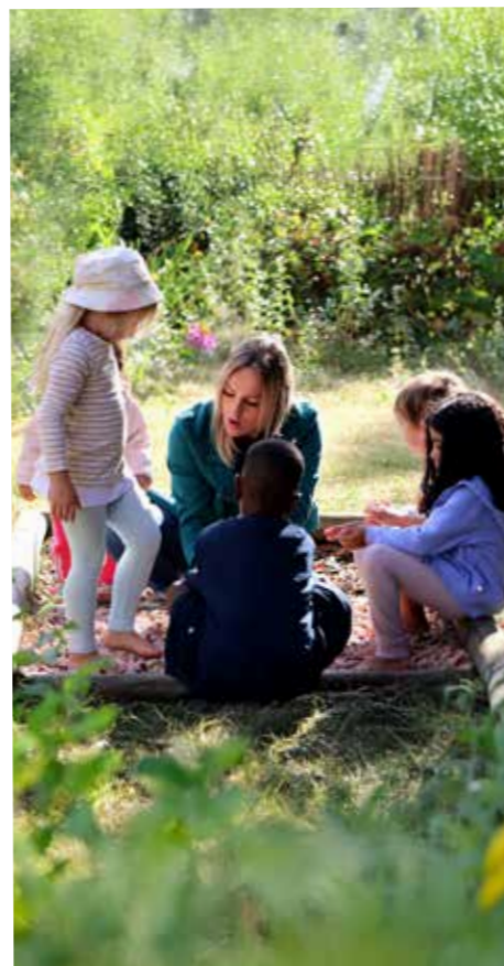
Gemeinschaft als gelebte Praxis in unseren Kitas

Wenn wir Demut leben, gelingt es uns, professionell zu handeln und zugleich menschlich verbunden zu sein.