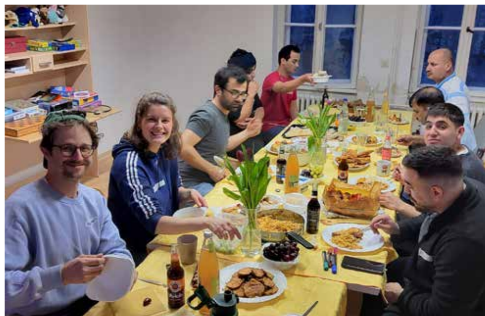
Austausch an der langen Tafel