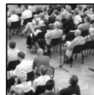
Seite 6 Geschichts- freunde