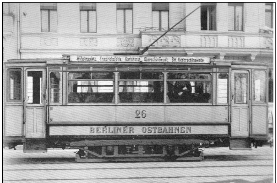
Triebwagen der Strecke Schöne- weide - Friedrichsfelde