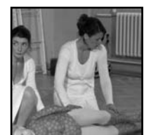
Seite 7 Treffen und Kultur