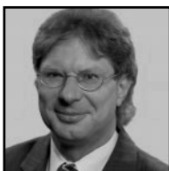
Seite 2 Interessante Karlshorster Persönlichkeiten