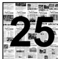
Seite 5 in eigener Sache