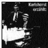
Seite 3 der Erzählkreis