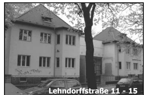
Lehndorffstraße 11 - 15