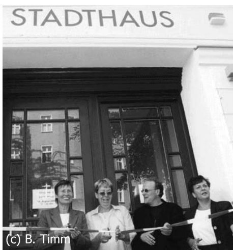
Eröffnung des Stadthauses am Tuchollaplatz am 18.08.2006

Vom 22. Dezember bis 5. Januar ist der offene Treff geschlossen. Das aktuelle Programm entnehmen Sie bitte den ausliegenden Flyern.