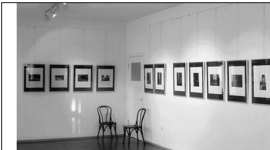
Galerie Carlshorst im Kulturhaus

Das diesjährige Kiezfest findet am 6. Mai als "Kulturfest Karlshorst" statt, fügt sich ein in den "Tag der offenen Tür" des bis dahin noch zu verschönernden Kulturhauses Karlshorst, hat