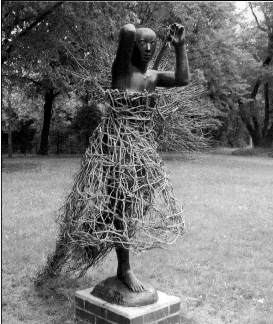
Die Entdeckung im Rheinsteinkpark oder neue Mode bei Karlshorster "Schönheiten" -Das Wetter war so schlecht, dass sich sogar die Figur im Rheinsteinkpark schützen musste.

oder per Post: Katholische Hochschule für Sozialwesen Köpenicker Allee 39 - 57 10318 Berlin (Raum 2.007)