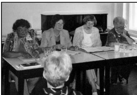
Der Karlshorster Erzählkreis zu Gast im Kulturhaus

bieten die Mitglieder des Erzählkreises Karlshorst auf unterhaltsame Weise an.