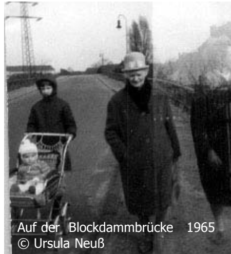
Auf der Blockdammbücke 1965

Stellen bieten im Winter auch heute noch beste Rodelmöglichkeiten. -