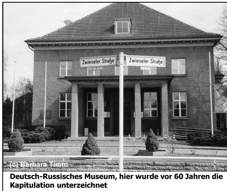
Deutsch-Russisches Museum, hier wurde vor 60 Jahren die Kapitulation unterzeichnet

Inhaftierten mußten u. a. beim Ausbau der Strecke am Bahnhof Karlshorst arbeiten, wobei ein Fall von Zivilcourage dokumentiert wurde: Irgendwann zwischen April 1942 und Mai 1943 konnte vom S-Bahnhof Karlshorst aus beobachtet werden, wie ein Bewacher einen jungen Polen schwer mißhandelte. Auf dem Rückweg ins Lager Wuhlheide begleiteten daraufhin etwa 30 Menschen das Häftlingskommando quer durch Karlshorst bis zum Lagertor und beschimpften die Bewacher. Die noch bis zum Tor dabei gebliebenen 8-10 Personen wurden schließlich vom Lagerkommandanten Elbers vertrieben.