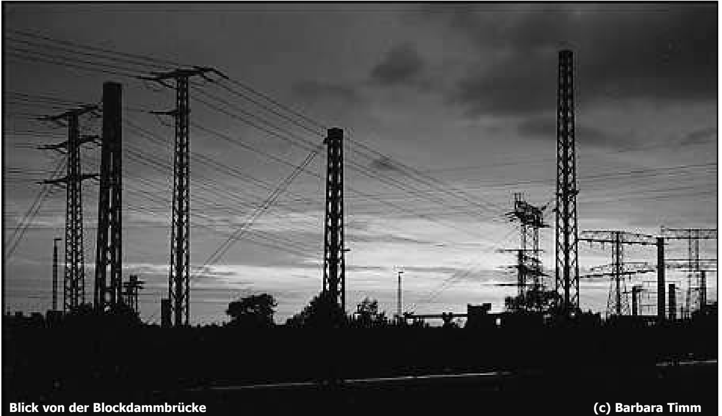
Blick von der Blockdammbücke