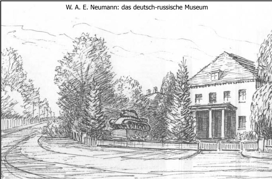
W. A. E. Neumann: das deutsch-russische Museum

mee erobert und von ihr in der Folgezeit als Stab, Amtssitz des Obersten Befehlshabers der Sowjetischen Militäradministration in Deutschland (SMAD), Sitz der Sowjetischen Kontrollkommission (Sowjetische Hohe Kommission) und als Standortkommandantur genutzt. Im November 1967 wurde hier das "Museum der bedingungslosen Kapitulation des faschistischen Deutschland im Krieg 1941-1945" unter der Regie der sowjetischen Armee eingerichtet und von mehr als 2 Millionen Menschen besucht.