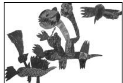
Nikolas Ney (Sonderpreis, Klasse 3)

Alle Arbeiten sind im Internet http://www.karlshorst.de (Rubrik Kita und Schule, Bereich BIP-Schule) veröffentlicht.